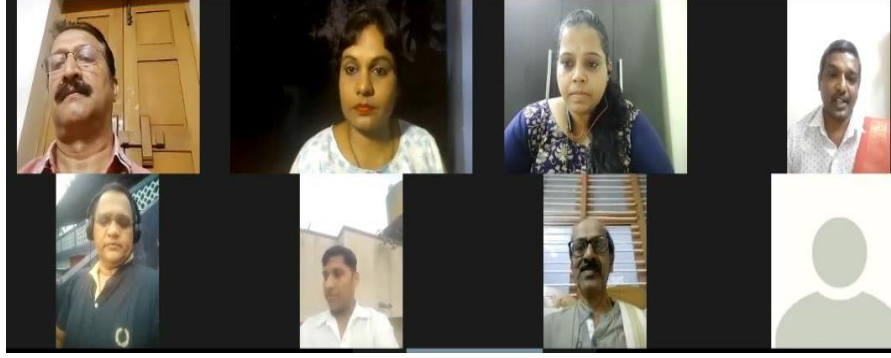
ದಿನಾಂಕ 02-04-2022 ರ ನಾದ ನೂಪುರ ವಂಡಾರು ಡಿಜಿಟಲ್ ಪತ್ರಿಕೆಯ ಆನ್ ಲೈನ್ ಜಡುಗಡೆಯ ಕಾರ್ಯಕ್ರಮದಲ್ಲ ಭಾಗವಹಿಸಿದ್ದ ಅತಿಥಿಗಳು